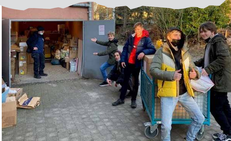
Schüler und Hausmeister lagern die Spendenpakete