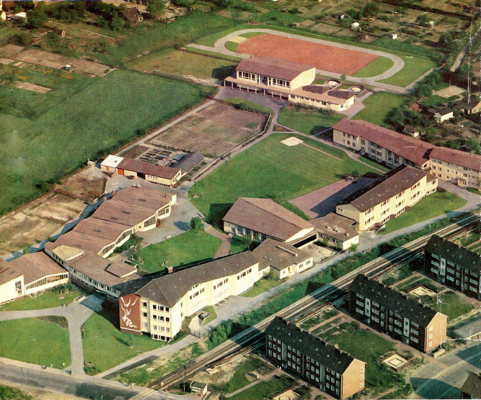
Foto der Hiberniaschule 1964 zur Zeit der Einweihung